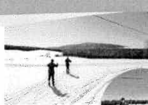
Le Centre de ski de fond La Clé des Bois est un endroit idéal pour la pratique d'un sport et pour vivre à l'activité physique.

Le Centre de ski de fond La Clé des Bois est un organisme à but non-lucratif. Chaque année, un programme de bénévolat est proposé et nous sommes fiers de compter sur vous pour offrir à tous les niveaux de compétence les meilleures conditions. Mais surtout, la sécurité est assurée par plusieurs skieurs expérimentés et disponibles à l'écoute aux entraînements.