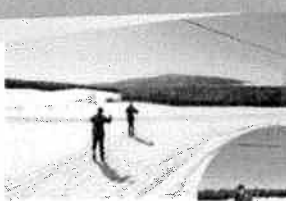
La Clé des Bois est le plus important réseau de ski de fond de la région et une belle occasion de vivre à l'activité physique.

Le Centre de ski de fond « La Clé des Bois » est un organisme à but non-lucratif. Chaque année, un programme de bénévolat est proposé et nous sommes fiers de compter sur vous pour offrir à nos membres un service de qualité. Nous sommes fiers de compter sur vous pour offrir à nos membres un service de qualité. Nous sommes fiers de compter sur vous pour offrir à nos membres un service de qualité.